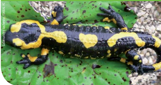
Salamandre tachetée

L'intégralité de l'arrêté est téléchargeable sur le site : www.franche-comte.developpement-durable.gouv.fr