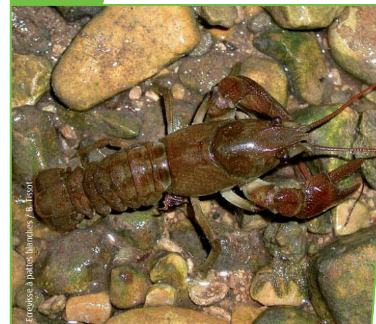
Écrevisse à pattes blanches / B. Tissot

Arrêté préfectoral de protection de biotope du 1 er juillet 2009